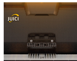
Zentrale Ausgabeeinheit mit LED